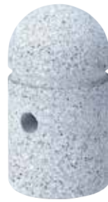
「反射ベルト」対応可

固定式: ブロック工/0.04人 普通作業員/0.07人 可動式: ブロック工/0.04人 普通作業員/0.06人