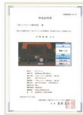
明度証明書 (平均明度 3.0)